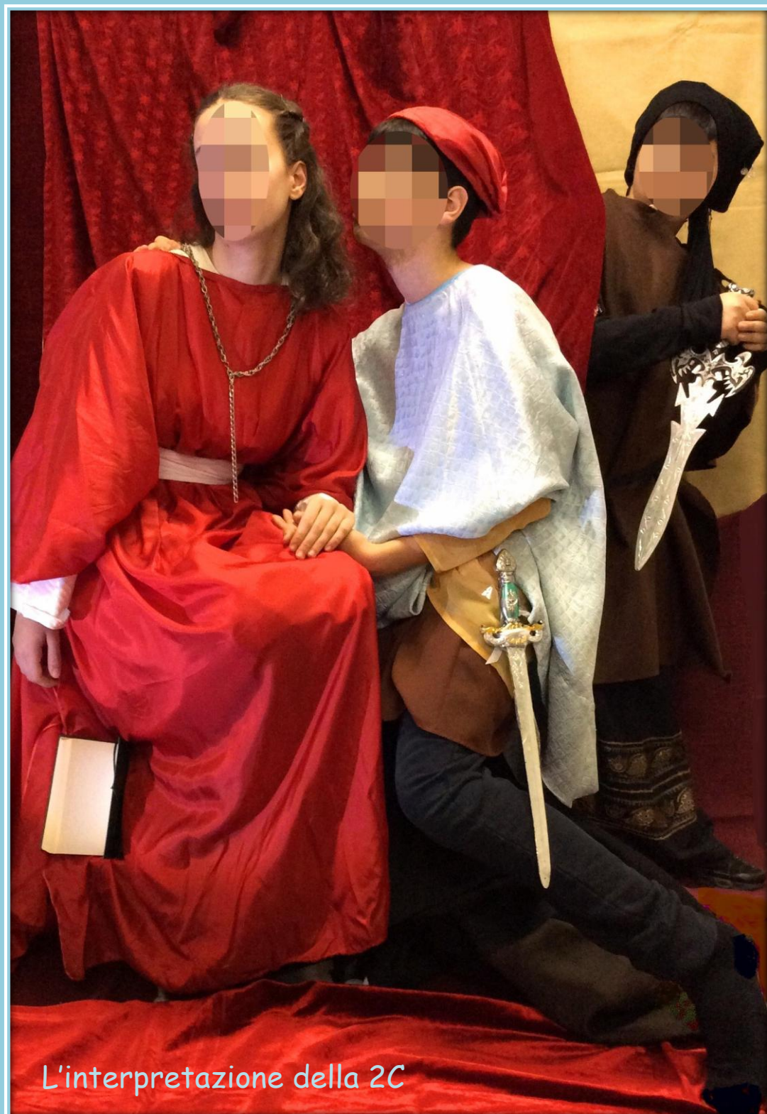
L'interpretazione della 2C